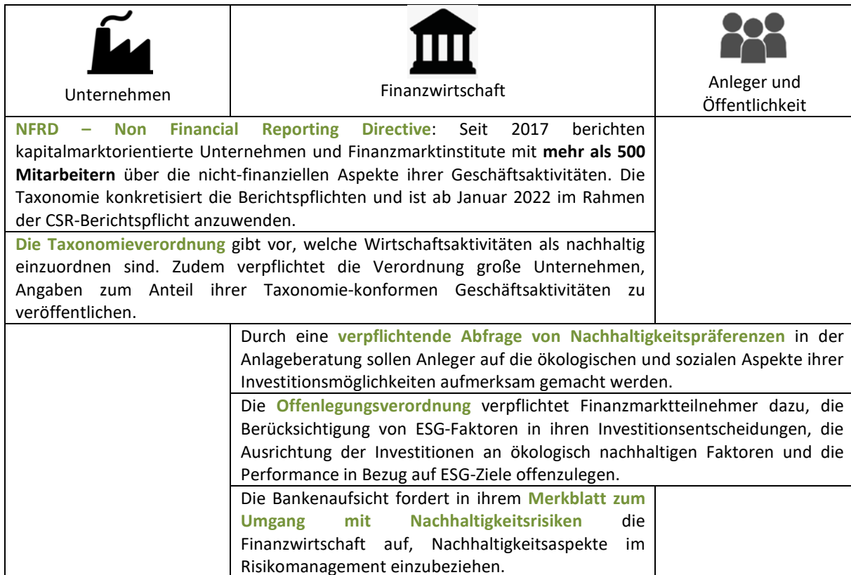
Tabelle 1: Übersicht von regulatorischen Maßnahmen in Bezug auf ESG-Daten